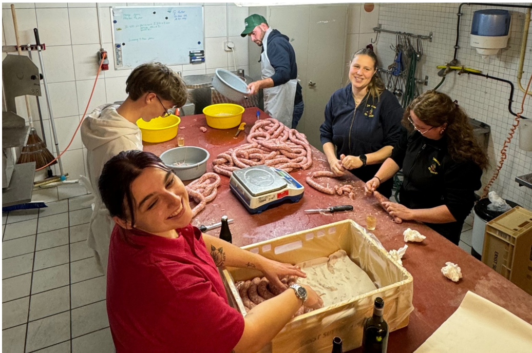
Boucherie pour le souper de soutien 2025

tinuerons nos recherches de sponsors et d'annonceurs auprès des entreprises régionales, afin d'avoir un maximum de soutien et un livret de fête à la hauteur de nos attentes. Depuis longtemps, nous aimons vous cuisiner des soupers « fait maison ». C'est pourquoi nous avons décidé de réitérer nos expériences pour le banquet du Giron ! Même si cela représente certainement deux fois plus de monde qu'à nos soupers de soutiens, ça ne nous fait pas peur ! Nous sommes motivés et nous avons entièrement confiance en nos chefs cuistots qui sauront mener cela d'une main de maître !