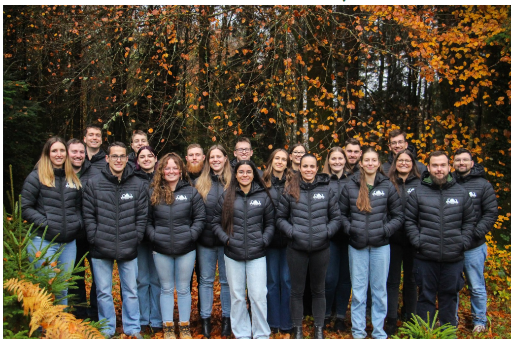
Photo officielle du Giron 2026, à la cabane de Ballens

UN BRAS TENDU, UNE HEURE DE VOTRE TEMPS, ET C'EST PEUT-ÊTRE UNE VIE ENTIERE QUI CONTINUE.