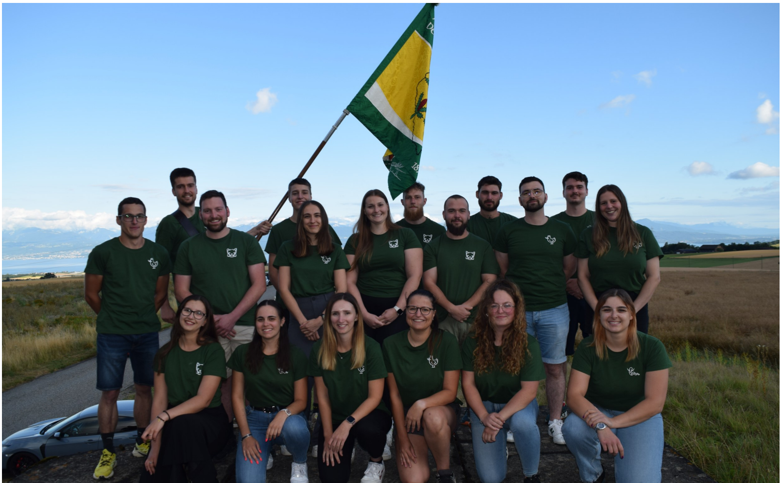
Première photo officielle au réservoir de St-Livres

Pour le Giron de l'Aubonne 2026 Au nom de la commission Communications