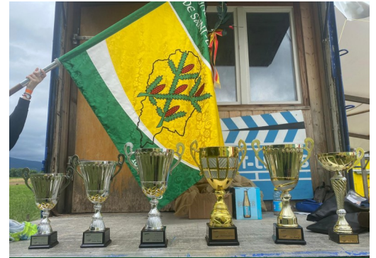
Coupes gagnées lors du Giron de l'Aubonne 2024 à Ballens

choses sérieuses, vous pourrez retrouver durant notre giron divers sports et activités. Le mercredi, aura lieu un loto, le jeudi du volley mixte, le vendredi du tir à la corde et le samedi de la pétanque ! Différents groupes de musique se produiront au caveau. Le programme complet et les horaires vous seront dévoilés courant 2026 .